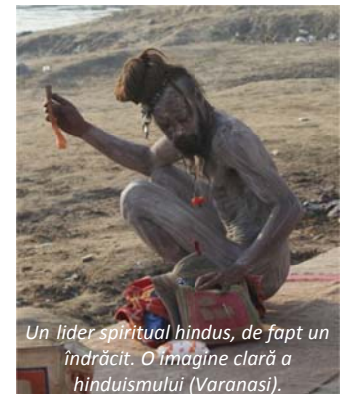
Un lider spiritual hindus, de fapt un îndrăcit. O imagine clară a hinduismului (Varanasi).