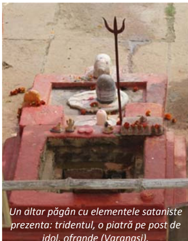
Un altar păgân cu elementele sataniste prezenta: tridentul, o piatră pe post de idol, ofrande (Varanasi).

lumea civilizată unii își permit luxul adoptării și întreținerii unui drac modern. Este al meu, nu-l dau nimănui și nu mă despart de el orice ar fi. El mă face fericit / fericită, el îmi aduce noroc, sunt dependent de el. Și aceasta este atitudinea hindușilor față de idolul hidos, grețos, oribil din casa lor.. Cât de aiuritor este să te închini în fața unui obiect de piatră, sau de lemn și să spui acesta este dumnezeul meu, la fel de dezumanizant este să te închini în fața idolilor moderni din lumea civilizată. Prima întrebare pe care mi-am pus-o când am ajuns în India a fost: „Care au fost greșelile făcute de coloniștii englezi de a ajuns națiunea asta în halul în care se află? Este ceva ce trebuie învățat din această istorie pentru a nu o mai repeta?” Răspunsul l-am găsit la finalul pelerinajului – problema principală nu