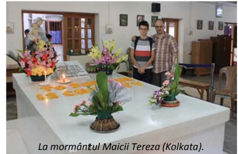
La mormântul Maicii Tereza (Kolkata).

India este o țară frumoasă, cu potențial turistic ridicat, oameni deosebiți și mâncăruri sofisticate. Însă nu pentru turism am fost acolo în special. M-a interesat să văd și să aud cum Împărăția lui Dumnezeu se dezvoltă, crește în această parte a lumii. Iată câteva concluzii după întoarcerea în țară: