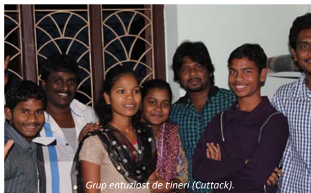
Grup entuziast de tineri (Cuttack).

Se citea pe fața ei o credință vie și de nezdruccinat. Dar și o dorință de a spune și altora despre Domnul. Cum? Mergă împreună cu alți tineri pe stradă și încep să cânte cântări. Numai vocal pentru că nu au nici un instrument muzical. Le-ar prinde bine o chitară, dar nu o aveau. Însă nimic nu i-a împiedicat să evanghelizeze. Lumea se adună pentru că sunt frumoase cântecele. Apoi unul dintre ei predică Evanghelia. Unii sunt interesați, alții batjocoresc. Dar lucrarea merge înainte și oameni sunt mântuiți. Am întrebat-o și mi-a răspuns foarte clar: nimic în lume nu ar dezlipi-o de Domnul și de lucrarea misionară – nici necazul, nici sărăcia, nici boala, nici măcar un făt frumos cu ochi albaștri.